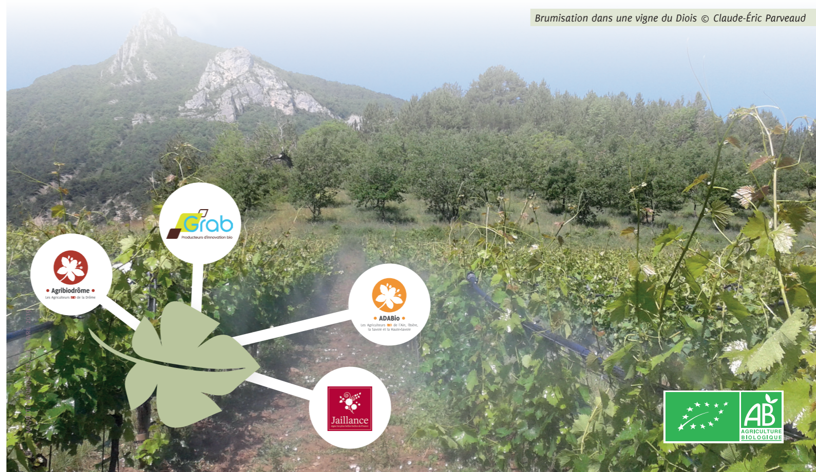
Brumisation dans une vigne du Diois

Concernant les essais classiques, parmi les substances testées en 2019 et 2020 figurent le vinaigre (acide acétique à différentes concentrations), la décoction de prêle, l'huile essentielle de thym à thymol, le chitosan ou encore le PREV-AM® (huile essentielle d'orange douce). Chacune de ces modalités est répétée au sein de la parcelle expérimentale et comparée à des références connues.