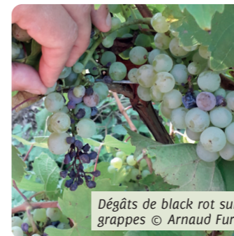
Dégâts de black rot sur grappes

L'objectif général du projet est d'identifier les substances et des pratiques alternatives efficaces localement contre le mildiou de la vigne ainsi que contre le black rot. L'ADABio, Agribiodrome, le GRAB et la Cave de Die Jaillance se proposent de répondre à cet objectif via un réseau d'essais, situé dans plusieurs vignobles de la région (Diois, Savoie, Bugey et Isère).