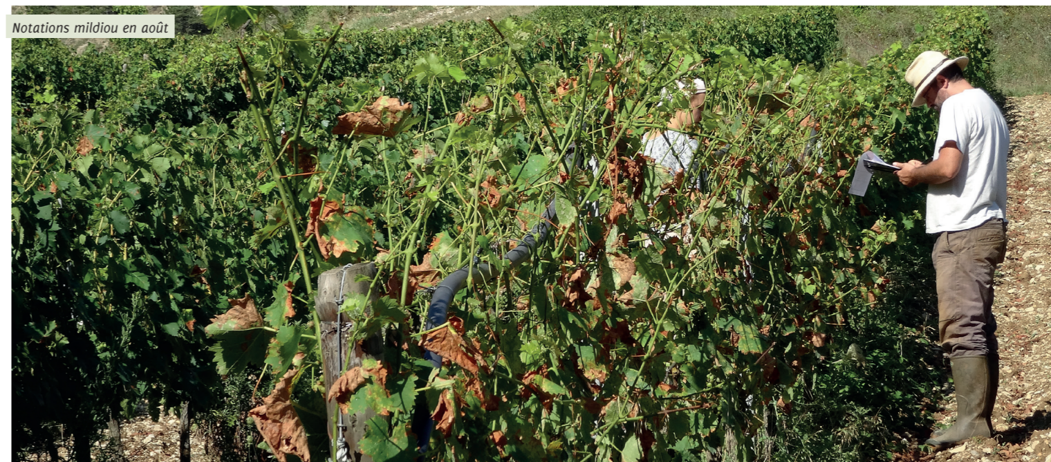
Notations mildiou en août

PREV-AM® : Il s'agit d'un produit de biocontrôle à base d'huile essentielle d'orange douce (60 g/L). En 2020, l'ADABio a comparé l'efficacité d'une conduite sans cuivre avec une conduite de référence utilisant du cuivre (3,3 kg/ha en référence forte et 1,2 kg/ha en modalité bas intrants de Cu total sur la saison). Dans la conduite sans cuivre, la protection contre le mildiou est assurée par des traitements préventifs à base d'algues (MC Cream®) et d'oligosaccharides (Bastid®), ainsi que des traitements à base de Prev-Am® lorsque les risques prévus de contamination sont les plus forts (risques prédits à l'aide d'un modèle). Le Prev-Am® a été appliqué 5 fois et les doses ont été diminuées à 75 % et 50 % sur les deux derniers traitements, du fait de l'observation de phytotoxicité. Ce programme sans cuivre est statistiquement équivalent aux conduites de référence (doses de cuivre réduites et "pleine" dose), bien qu'avec un feuillage un peu plus touché.